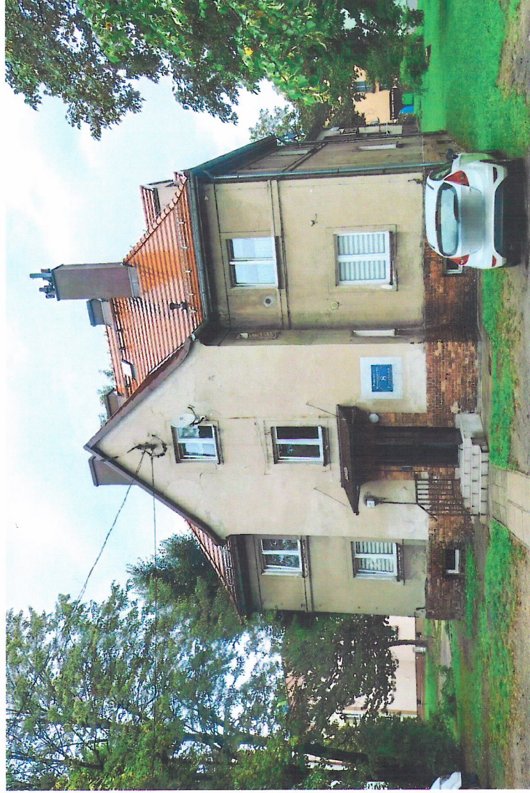
Widok budynku od południowego-zachodu

7. Fotografia z opisem wskazującym orientację w stosunku do sąsiednich terenów lub stron świata albo mapa z zaznaczonym stanowiskiem archeologicznym