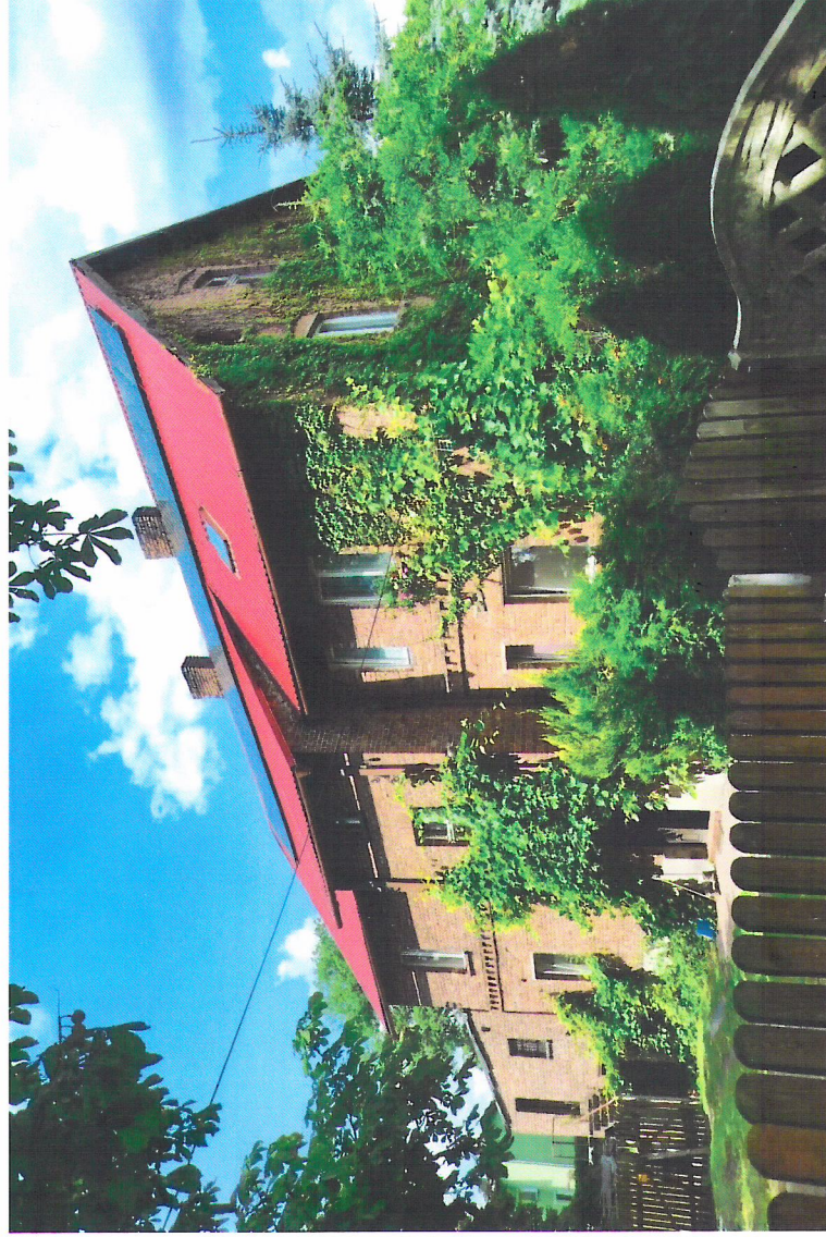
Widok od południowego-wschodu

7. Fotografia z opisem wskazującym orientację w stosunku do sąsiednich terenów lub stron świata albo mapa z zaznaczonym stanowiskiem archeologicznym