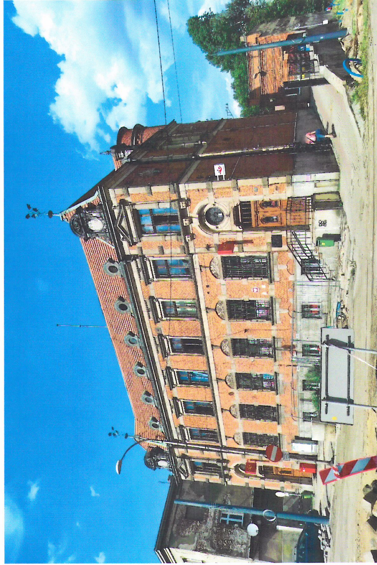
Widok budynku od północnego-zachodu

7. Fotografia z opisem wskazującym orientację w stosunku do sąsiednich terenów lub stron świata albo mapa z zaznaczonym stanowiskiem archeologicznym