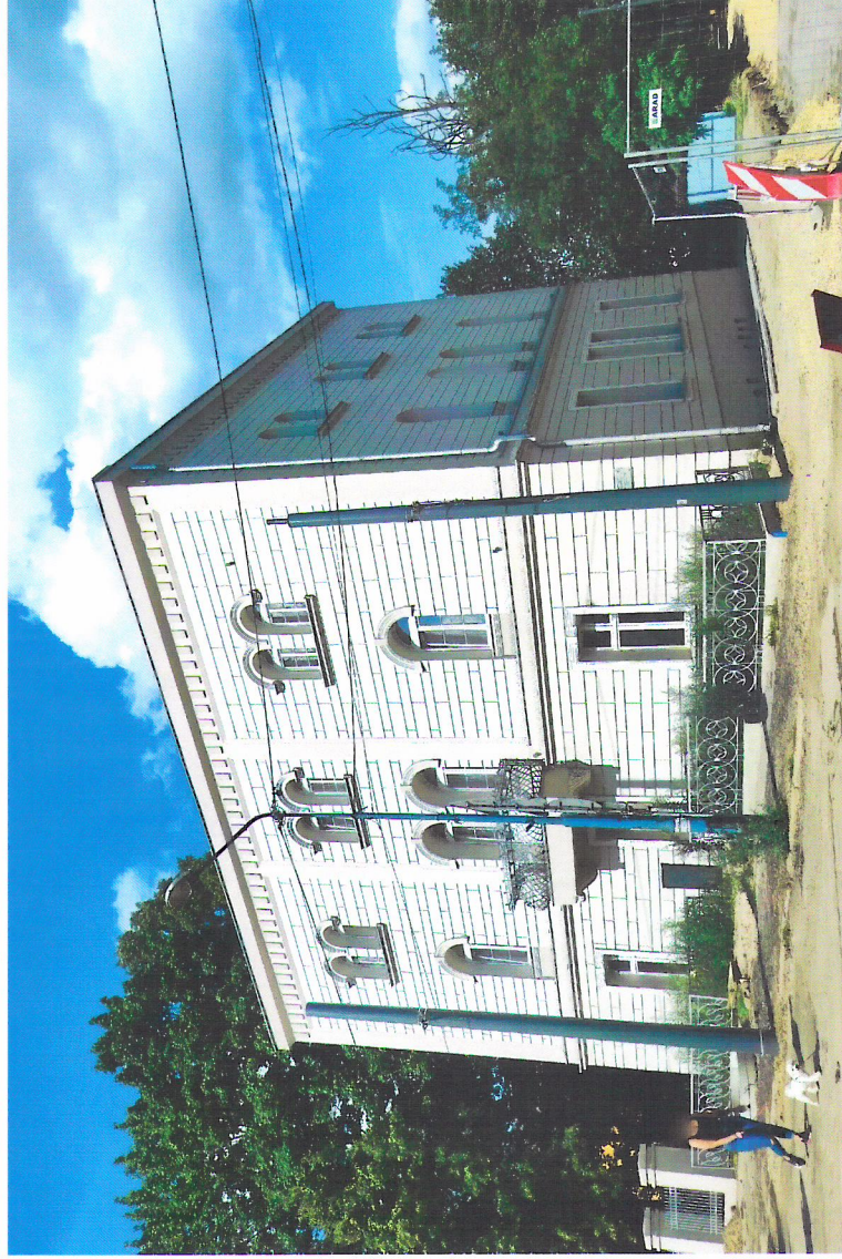
Widok budynku od południowego-zachodu

7. Fotografia z opisem wskazującym orientację w stosunku do sąsiednich terenów lub stron świata albo mapa z zaznaczonym stanowiskiem archeologicznym