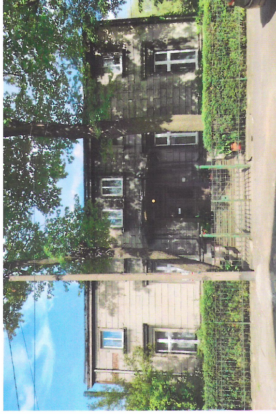
Widok budynku od południowego-zachodu

7. Fotografia z opisem wskazującym orientację w stosunku do sąsiednich terenów lub stron świata albo mapa z zaznaczonym stanowiskiem archeologicznym