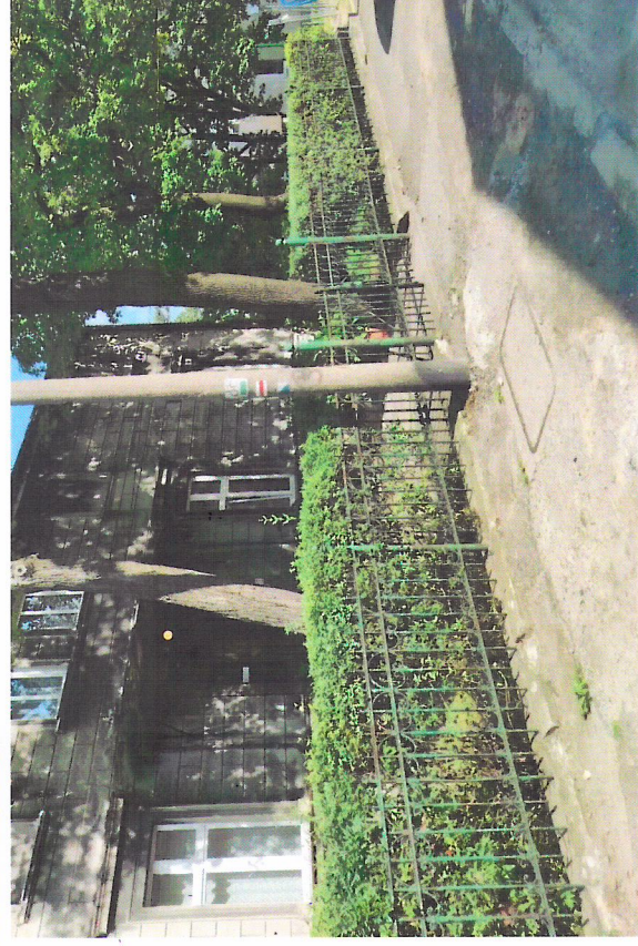
Widok ogrodzenia od zachodu