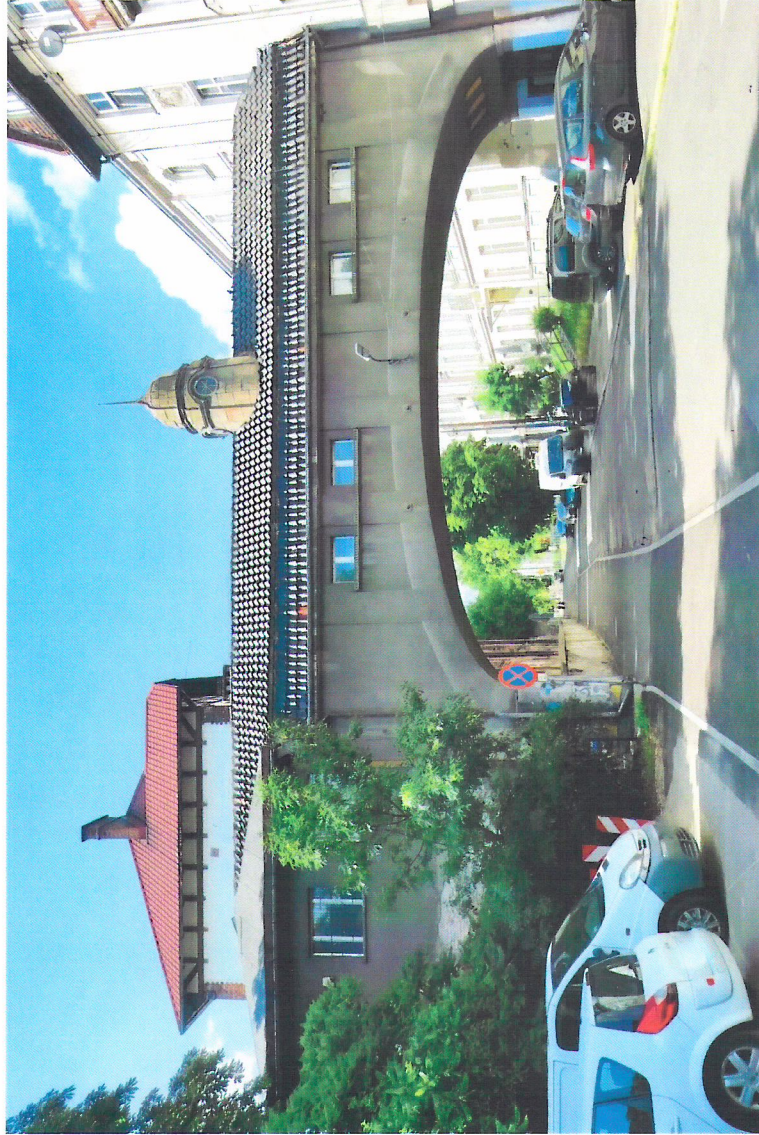
Widok budynku od południa

7. Fotografia z opisem wskazującym orientację w stosunku do sąsiednich terenów lub stron świata albo mapa z zaznaczonym stanowiskiem archeologicznym