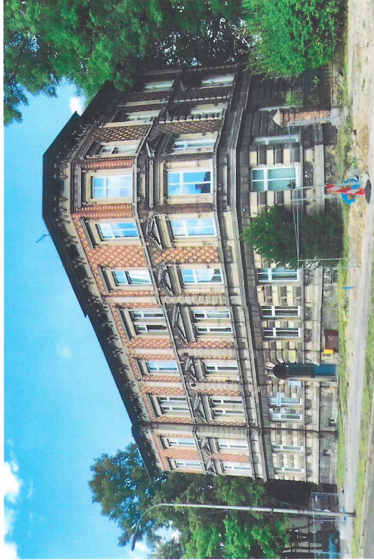
Widok budynku od południowego-zachodu

7. Fotografia z opisem wskazującym orientację w stosunku do sąsiednich terenów lub stron świata albo mapa z zaznaczonym stanowiskiem archeologicznym