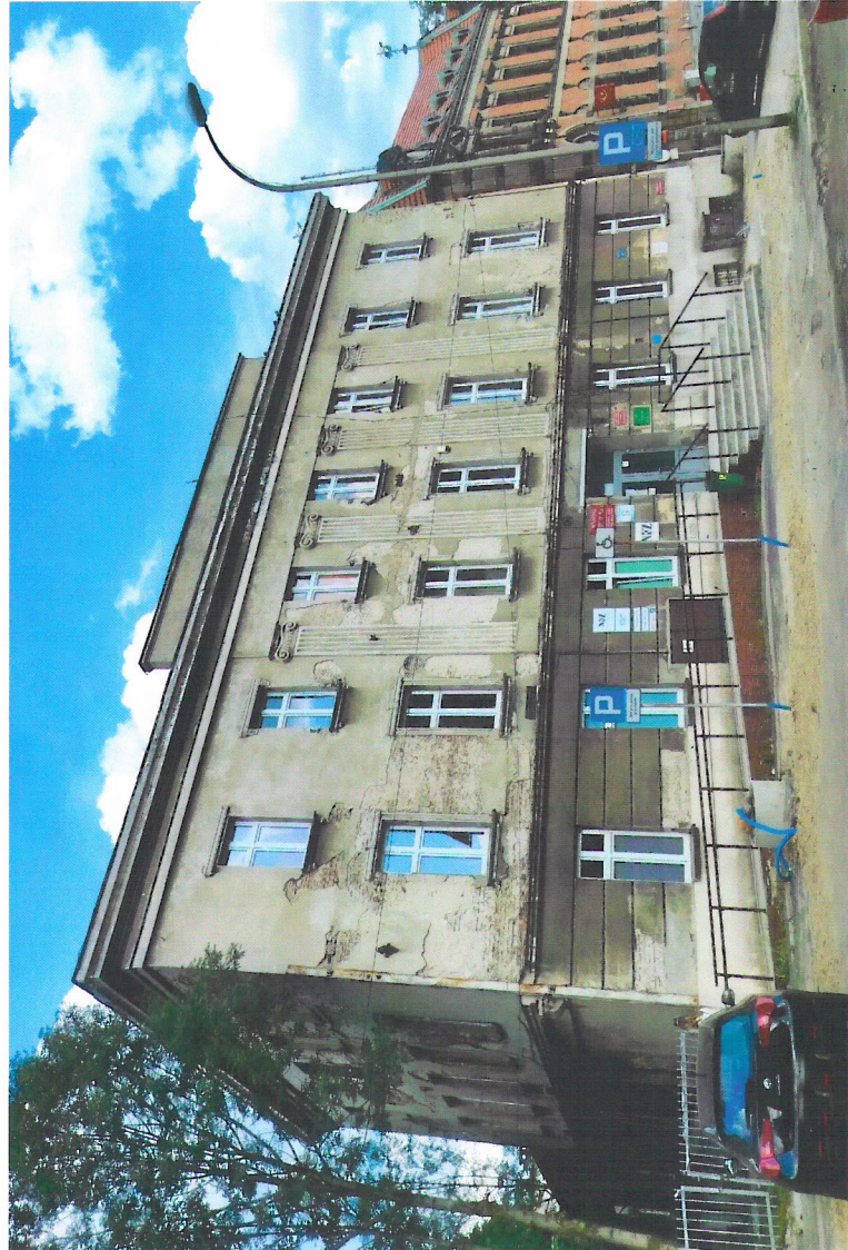
Widok budynku od północnego-zachodu

7. Fotografia z opisem wskazującym orientację w stosunku do sąsiednich terenów lub stron świata albo mapa z zaznaczonym stanowiskiem archeologicznym