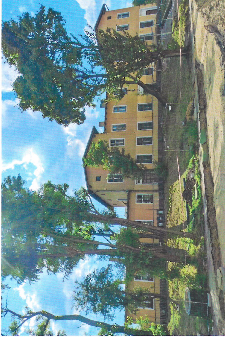
Widok budynku od wschodu

7. Fotografia z opisem wskazującym orientację w stosunku do sąsiednich terenów lub stron świata albo mapa z zaznaczonym stanowiskiem archeologicznym