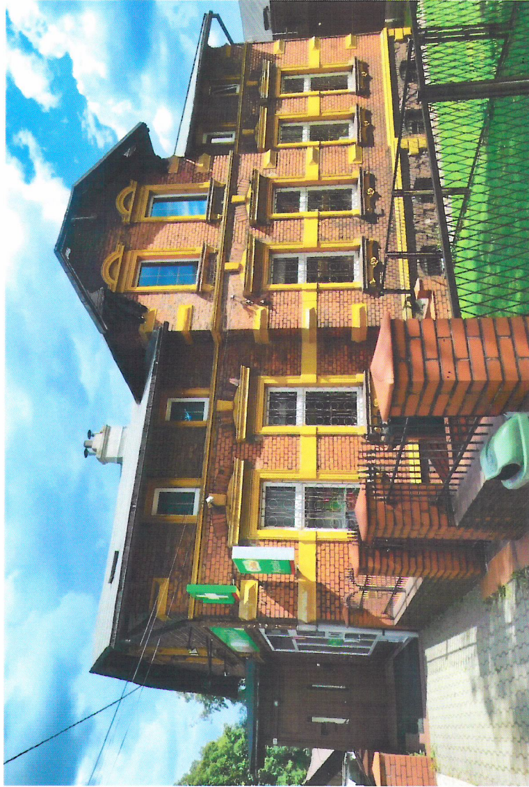
Widok budynku od północnego-zachodu

7. Fotografia z opisem wskazującym orientację w stosunku do sąsiednich terenów lub stron świata albo mapa z zaznaczonym stanowiskiem archeologicznym