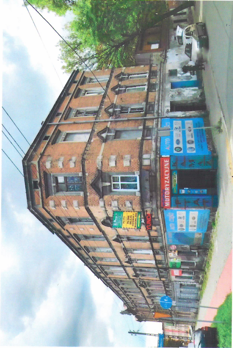
Widok budynku od północno-wschodu

7. Fotografia z opisem wskazującym orientację w stosunku do sąsiednich terenów lub stron świata albo mapa z zaznaczonym stanowiskiem archeologicznym