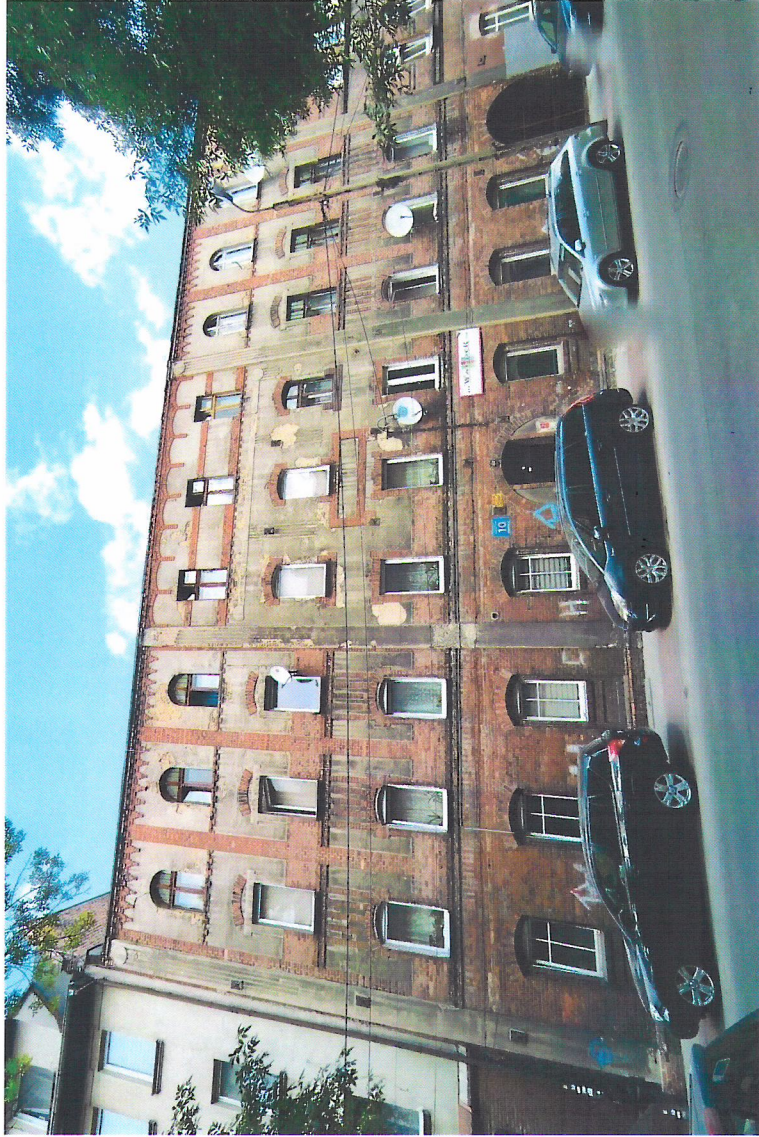
Widok budynku od południowego-wschodu

7. Fotografia z opisem wskazującym orientację w stosunku do sąsiednich terenów lub stron świata albo mapa z zaznaczonym stanowiskiem archeologicznym