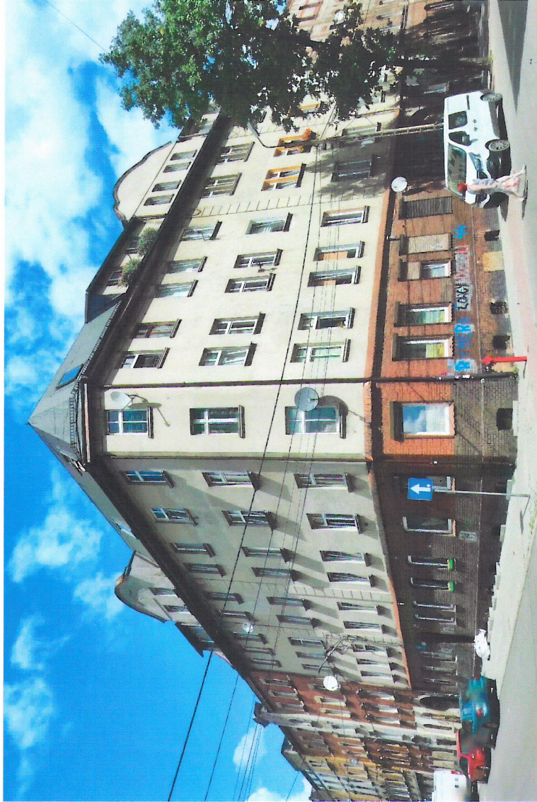
Widok budynku od południa

7. Fotografia z opisem wskazującym orientację w stosunku do sąsiednich terenów lub stron świata albo mapa z zaznaczonym stanowiskiem archeologicznym