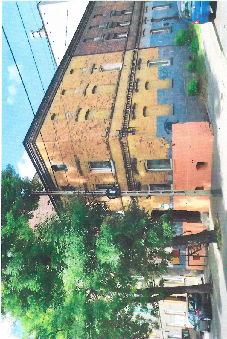
Widok budynku od południowego-wschodu

7. Fotografia z opisem wskazującym orientację w stosunku do sąsiednich terenów lub stron świata albo mapa z zaznaczonym stanowiskiem archeologicznym