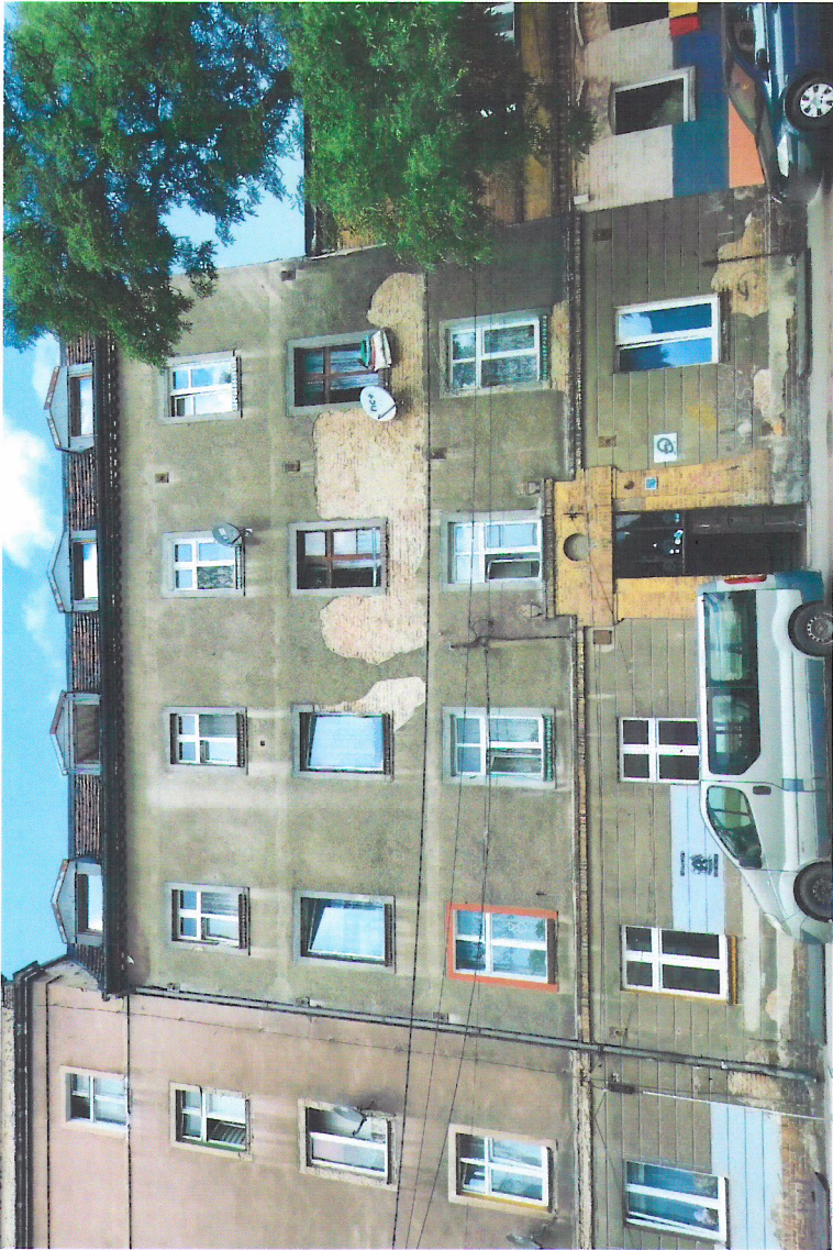
Widok budynku od południowego-wschodu

7. Fotografia z opisem wskazującym orientację w stosunku do sąsiednich terenów lub stron świata albo mapa z zaznaczonym stanowiskiem archeologicznym