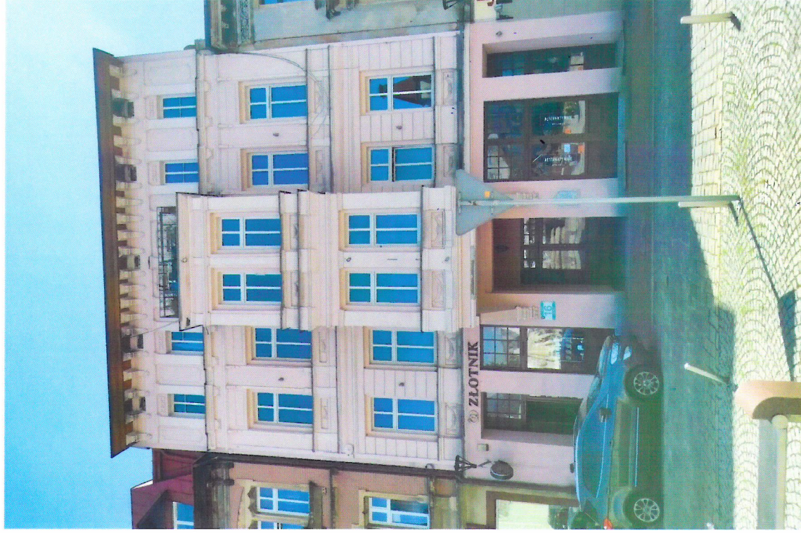
Widok budynku od północnego-zachodu

7. Fotografia z opisem wskazującym orientację w stosunku do sąsiednich terenów lub stron świata albo mapa z zaznaczonym stanowiskiem archeologicznym