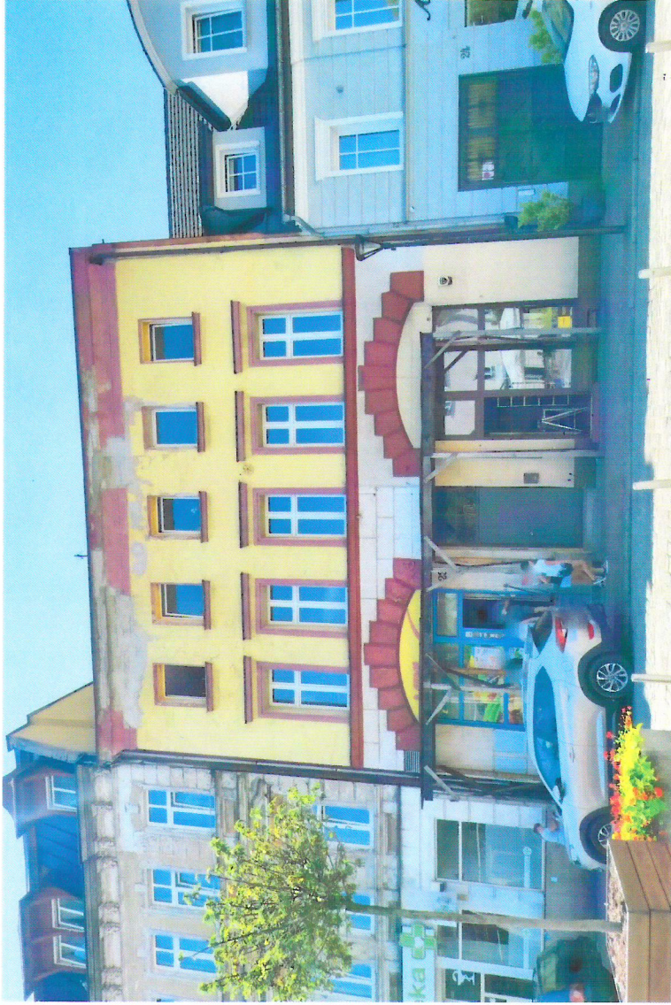
Widok budynku od północnego-wschodu

7. Fotografia z opisem wskazującym orientację w stosunku do sąsiednich terenów lub stron świata albo mapa z zaznaczonym stanowiskiem archeologicznym