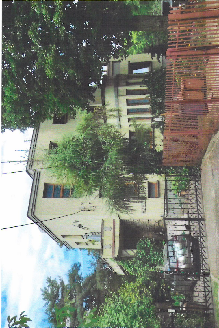
Widok budynku od północnego-wschodu

7. Fotografia z opisem wskazującym orientację w stosunku do sąsiednich terenów lub stron świata albo mapa z zaznaczonym stanowiskiem archeologicznym