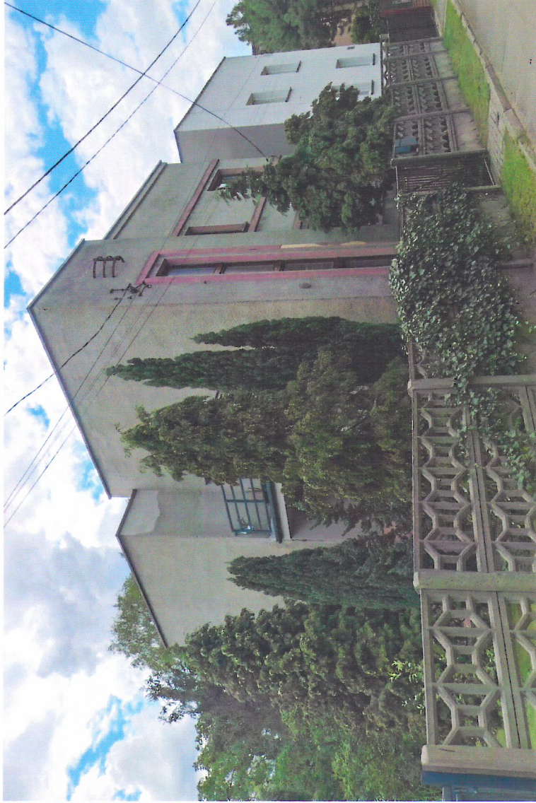
Widok budynku od północnego-wschodu

7. Fotografia z opisem wskazującym orientację w stosunku do sąsiednich terenów lub stron świata albo mapa z zaznaczonym stanowiskiem archeologicznym