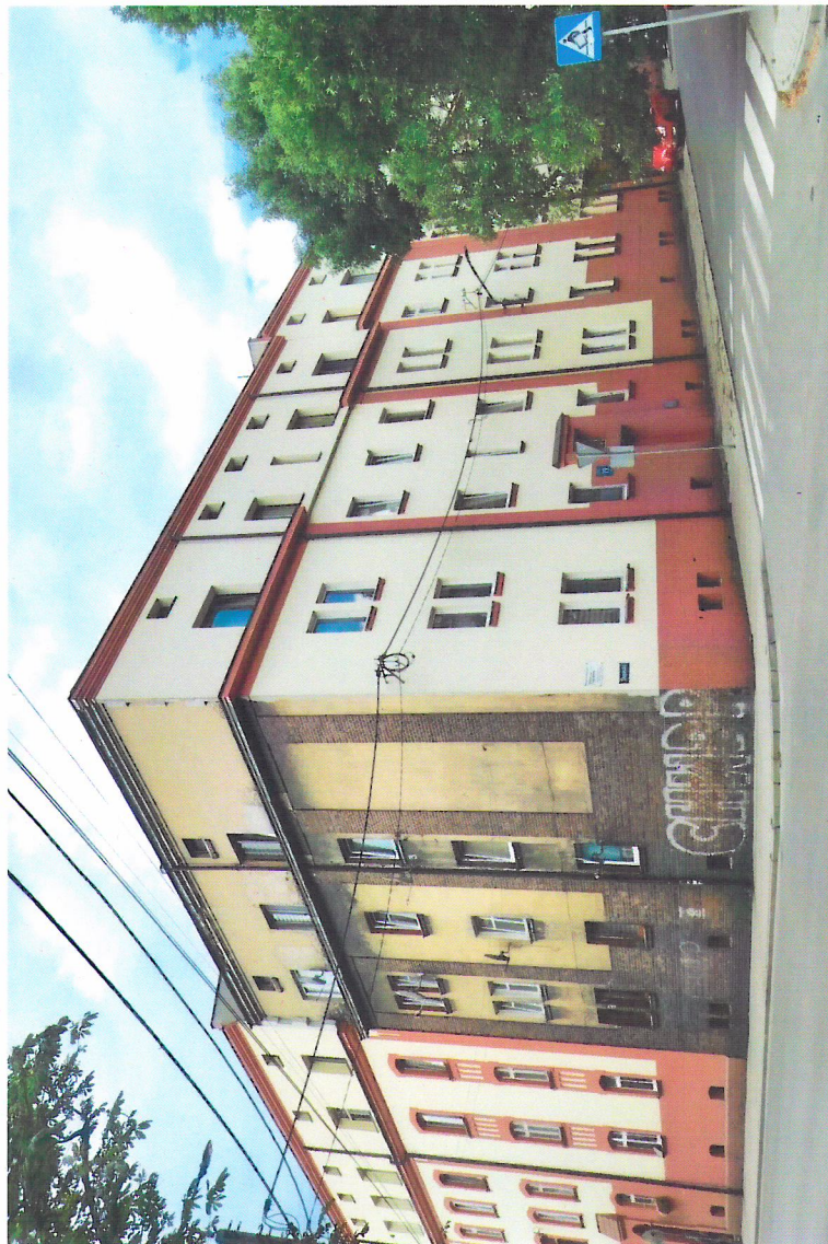
Widok budynku od południowego-wschodu

7. Fotografia z opisem wskazującym orientację w stosunku do sąsiednich terenów lub stron świata albo mapa z zaznaczonym stanowiskiem archeologicznym