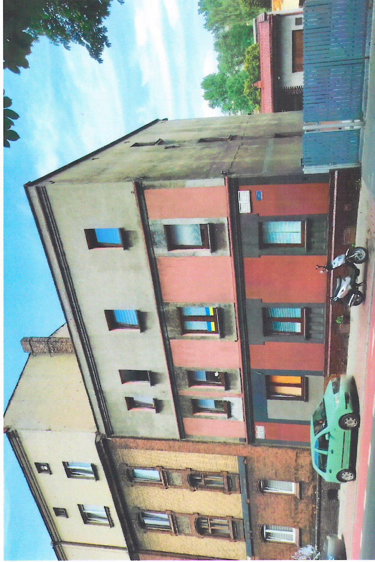
Widok budynku od południa

7. Fotografia z opisem wskazującym orientację w stosunku do sąsiednich terenów lub stron świata albo mapa z zaznaczonym stanowiskiem archeologicznym