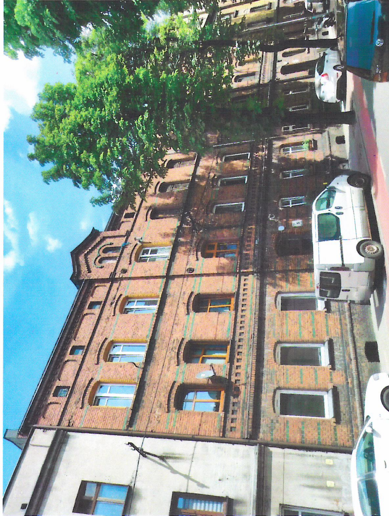
Widok budynku od południowego-zachodu

7. Fotografia z opisem wskazującym orientację w stosunku do sąsiednich terenów lub stron świata albo mapa z zaznaczonym stanowiskiem archeologicznym